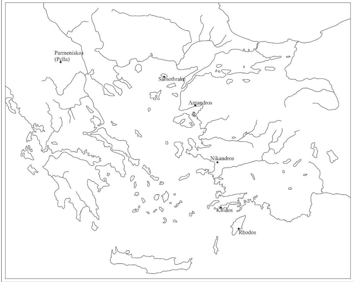
Figür 1: Tespit Edilen Amphoraların Üretim Merkezleri.