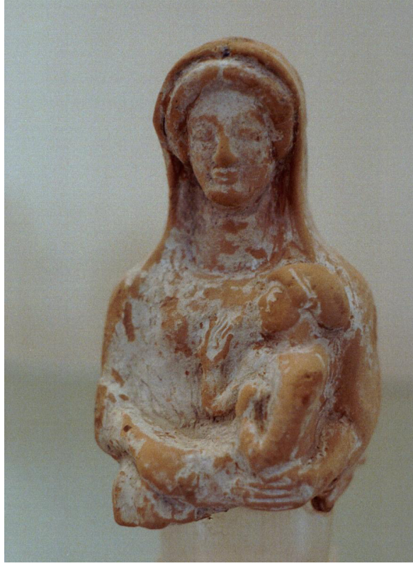
Figür 7: Artemis Kourotrophos Figürini, Pişmiş Toprak, MÖ 430-400, Brauron Arkeoloji Müzesi. (AM Brauron, inv. Bram31)