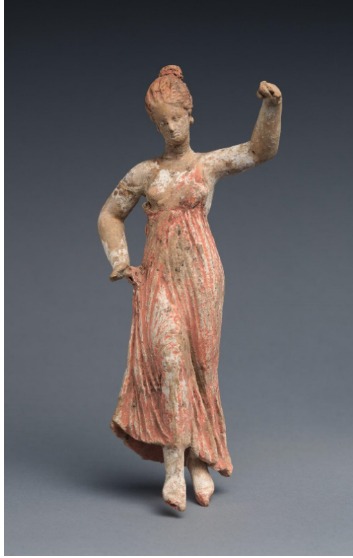
Figür 5: Dans Eden Kadın Figürini, Pişmiş Toprak, Güney İtalya Üretimi Yunan (Tarentum), MÖ 3. Yüzyıl, The Metropolitan Museum of Art. (Env. no. 12.232.13)