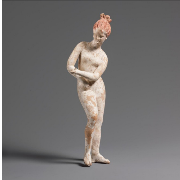
Figür 6: Çıplak Kadın Figürini, Pişmiş Toprak, Güney İtalya Üretimi Yunan (Tarentum), MÖ 3. yüzyıl, The Metropolitan Museum of Art. (Env. no. 13.227.14)