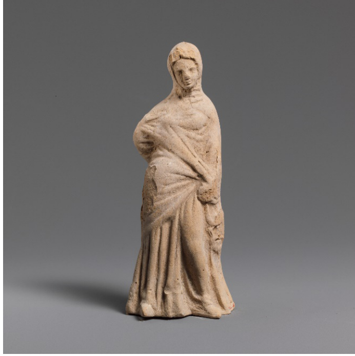
Figür 1: Örtülü Kadın Terrakotta Figürini, The Metropolitan Museum of Art.