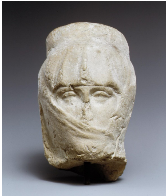
Figür 2: Örtülü Kadın Başı Terrakotta Figürini, Kıbrıs-Klasik II Dönem, MÖ 400-310, The Metropolitan Museum of Art.