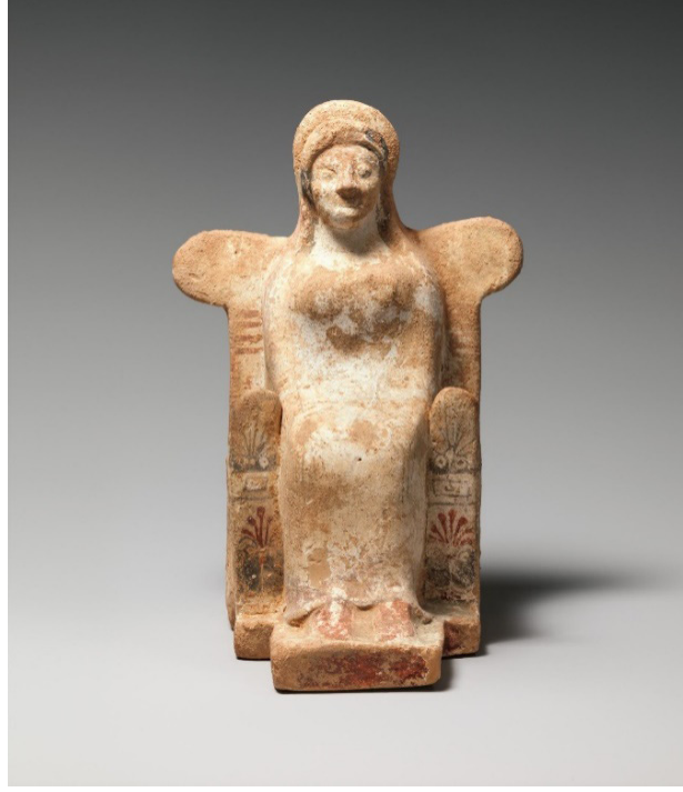
Figür 3: Tahtta Oturan Kadın Terrakotta Figürini, Boiotia, Geç MÖ 6. yüzyıl - Erken MÖ 5. yüzyıl, The Metropolitan Museum of Art.